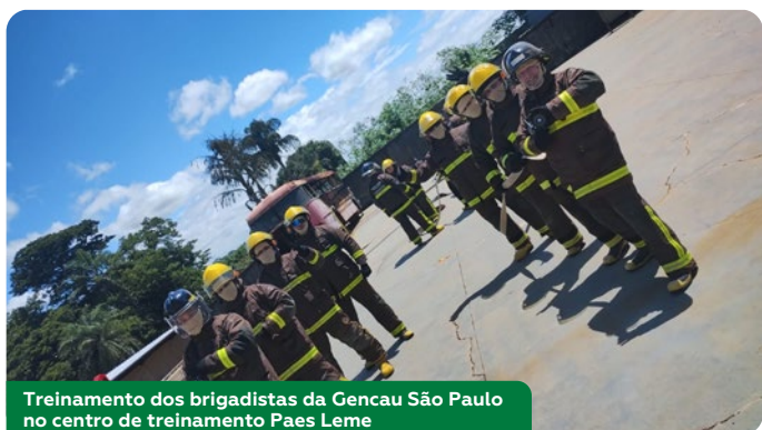
Treinamento dos brigadistas da Gencau São Paulo no centro de treinamento Paes Leme