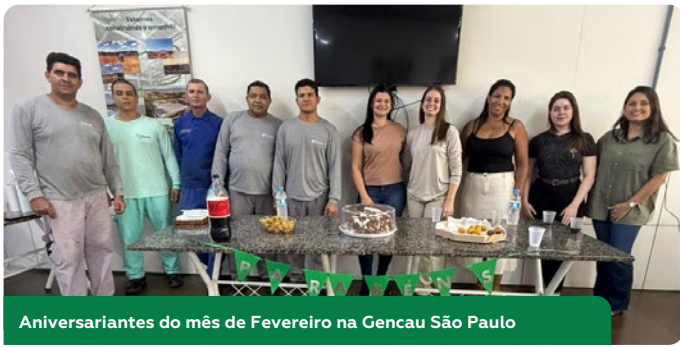
Aniversariantes do mês de Fevereiro na Gencau São Paulo