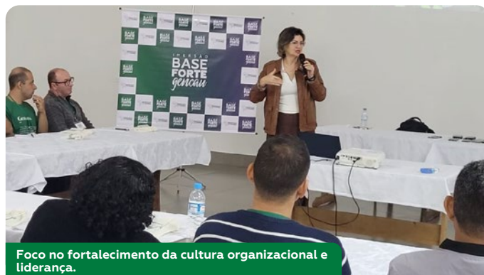
Foco no fortalecimento da cultura organizacional e liderança.