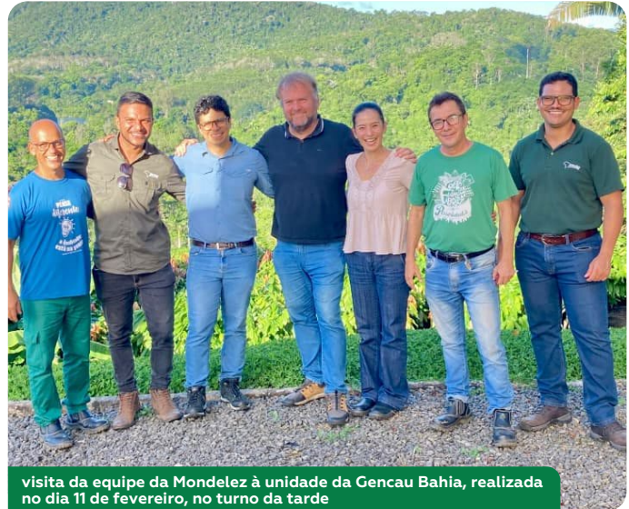
visita da equipe da Mondelez à unidade da Gencau Bahia, realizada no dia 11 de fevereiro, no turno da tarde