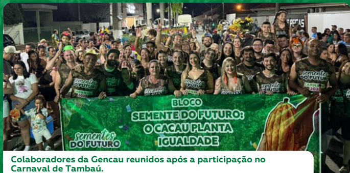
Colaboradores da Gencau reunidos após a participação no Carnaval de Tambaú.

Mais do que desfilar, apoiamos a cultura local e inspiramos outras empresas a fazerem o mesmo.