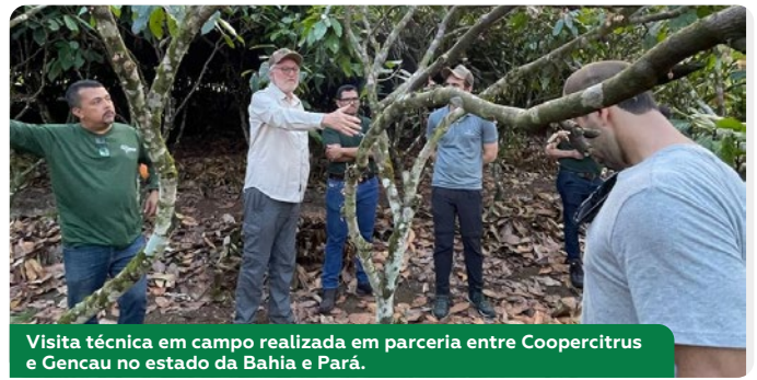
Visita técnica em campo realizada em parceria entre Coopercitrus e Gencau no estado da Bahia e Pará.