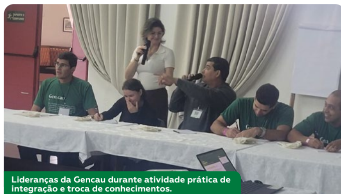
Lideranças da Gencau durante atividade prática de integração e troca de conhecimentos.

O evento aconteceu em Poços de Caldas e foi um grande sucesso!