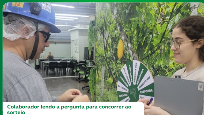
Colaborador lendo a pergunta para concorrer ao sorteio