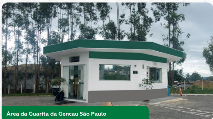
Área da Guarita da Gencau São Paulo