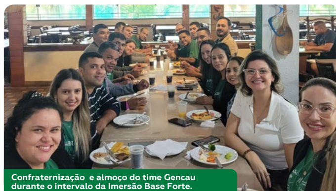
Confraternização e almoço do time Gencau durante o intervalo da Imersão Base Forte.