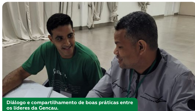
Diálogo e compartilhamento de boas práticas entre os líderes da Gencau.