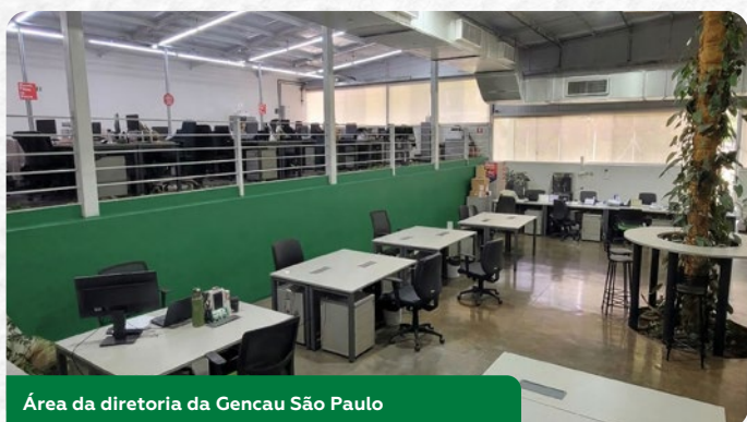
Área da diretoria da Gencau São Paulo