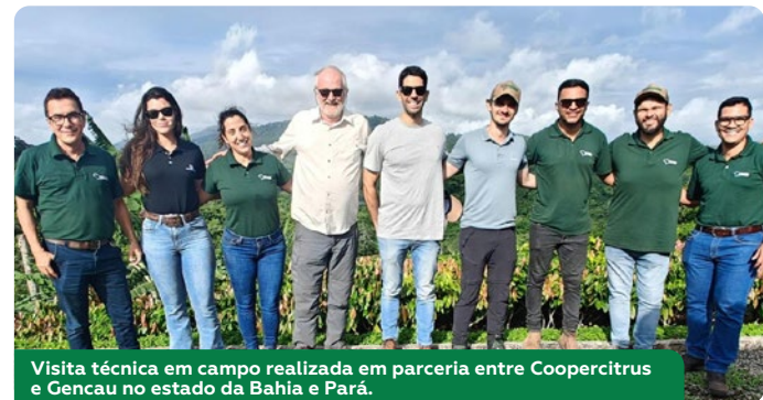
Visita técnica em campo realizada em parceria entre Coopercitrus e Gencau no estado da Bahia e Pará.