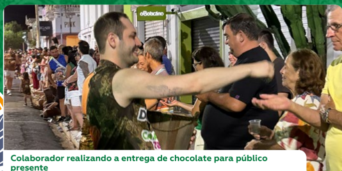
Colaborador realizando a entrega de chocolate para público presente