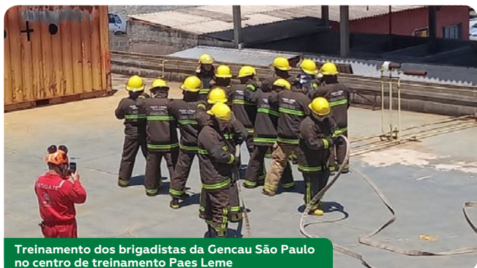
Treinamento dos brigadistas da Gencau São Paulo no centro de treinamento Paes Leme

Essa iniciativa visa não apenas cumprir normas, mas consolidar uma cultura de cuidado compartilhado. Ao investir na formação de novos brigadistas e na reciclagem dos veteranos, a Gencau reafirma seu compromisso inegociável com a preservação da vida e com um ambiente de trabalho cada vez mais seguro e responsável.