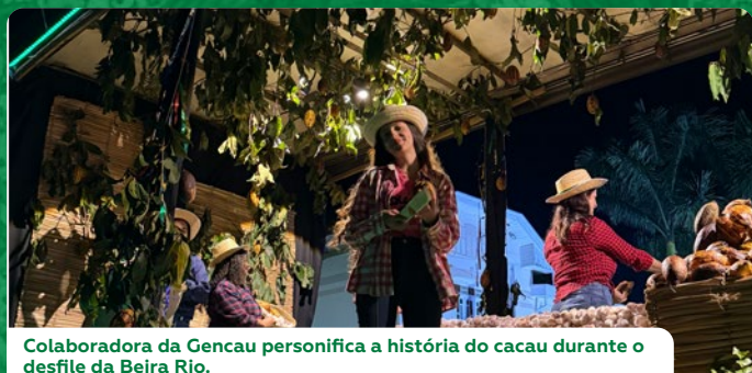
Colaboradora da Gencau personifica a história do cacau durante o desfile da Beira Rio.