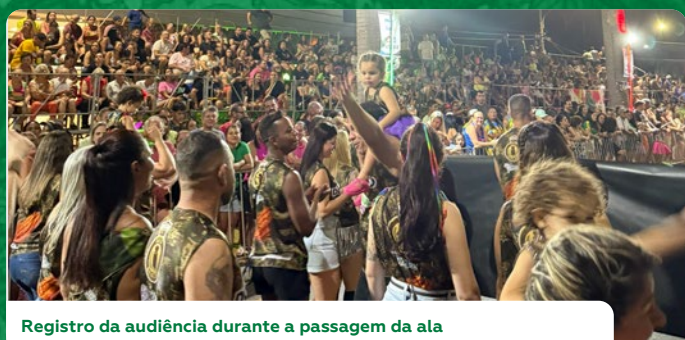
Registro da audiência durante a passagem da ala