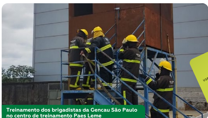
Treinamento dos brigadistas da Gencau São Paulo no centro de treinamento Paes Leme