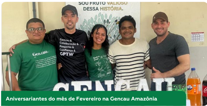
Aniversariantes do mês de Fevereiro na Gencau Amazônia