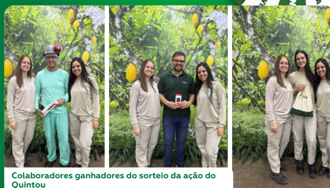
Colaboradores ganhadores do sorteio da ação do Quintou