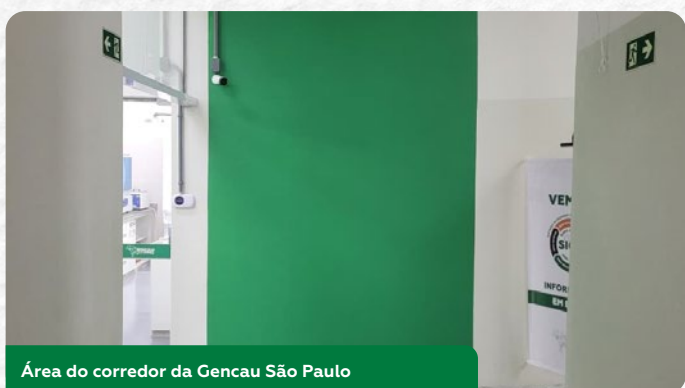
Área do corredor da Gencau São Paulo