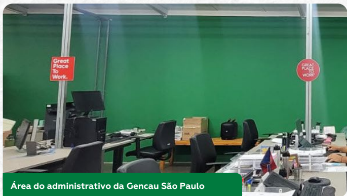
Área do administrativo da Gencau São Paulo

Quem circula pela unidade já notou as melhorias no ambiente de trabalho. Diversos pontos estratégicos, como o CEC, laboratórios, administrativo, diretoria e Gencoffee, receberam nova pintura. Pedimos a atenção de todos para as sinalizações de isolamento, especialmente nos corredores entre a barreira e o acesso à fábrica, utilizando sempre as faixas de pedestres para garantir a segurança de todos.