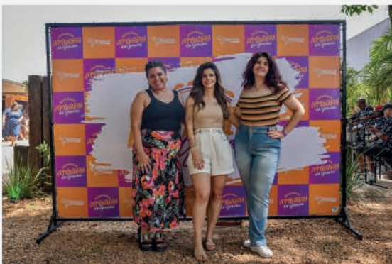
Time de MKT confraternizando:)