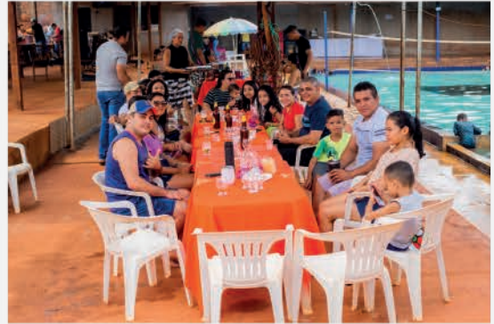
Famílias confraternizando na Sabadeira, em Medicilândia.