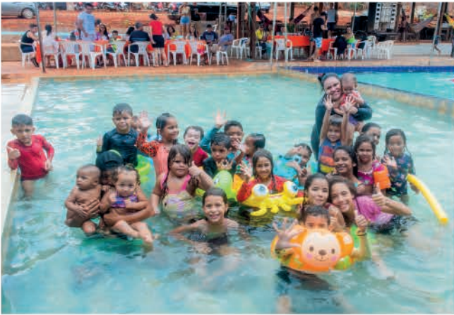
Crianças se divertem na Sabadeira da Gencau.

Seguimos juntos para construir tantos momentos marcantes como esse, time!