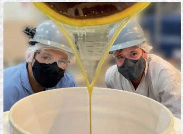
Primeiro teste do Desodorizador.