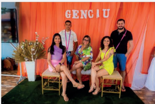
Parte do time de Originação e Sustentabilidade na Confraternização.