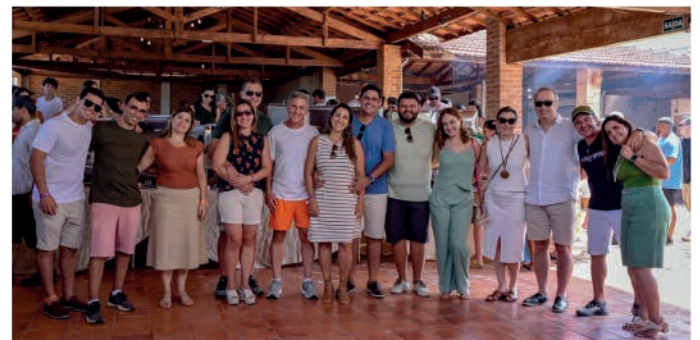
Liderança da Gencau comemorando os resultados do ano!