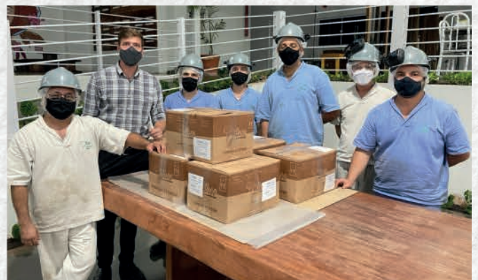
Primeiro lote de manteiga produzido.