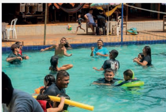
Sabadeira da Gencau