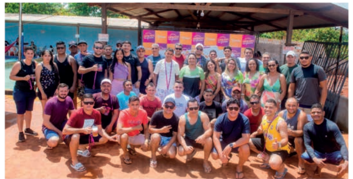
Time Gencau se reúne em Medicilândia para celebrar o ano de 2023!

Seja muito bem-vindo, 2024! Nós estamos prontos para as suas 366 novas possibilidades!