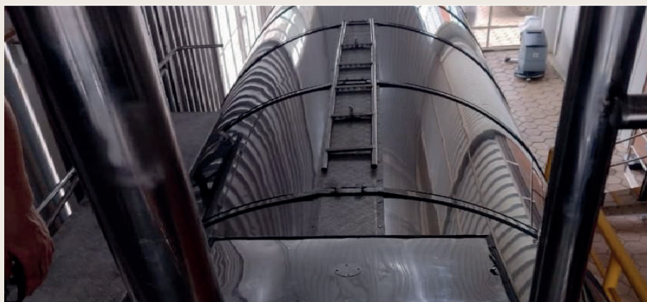
Primeiro carregamento a granel da nossa Manteiga Desodorizada Crystal.