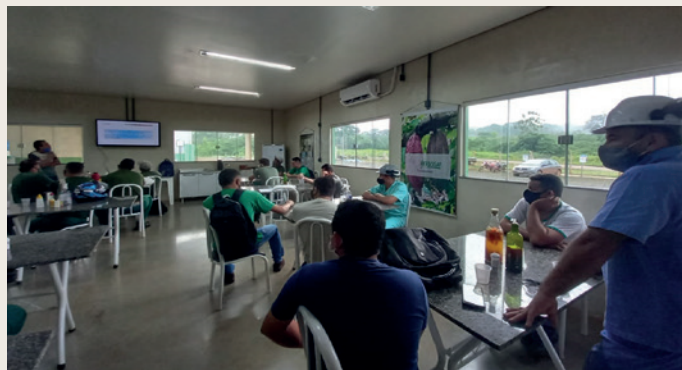
Colaboradores da Gencau-PA debatem a importância da saúde masculina.

Tirou uma fotografia bonita na empresa? Mande sua foto para o e-mail comunicação@gencau.com e contribua com fotografias para o nosso #momentogencau (Lembrando que dentro da fábrica são proibidos registros fotográficos)