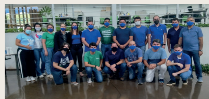
Time Gencau-SP celebra Novembro Azul.