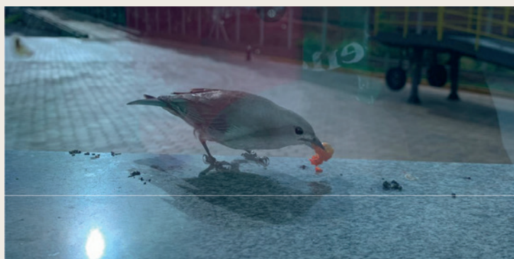
Nosso funcionário do mês na Gencau-SP.