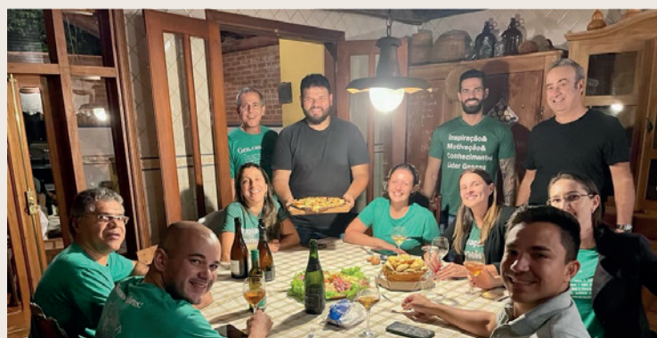
Momento de descontração com parte da liderança Gencau.