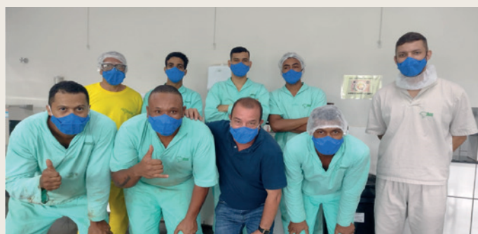
Colaboradores da Gencau-SP atentos a conscientização no Novembro Azul.