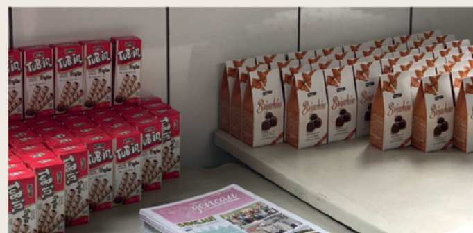
Dia da Qualidade comemorado com degustação e informação.