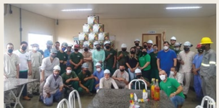
Colaboradores da Gencau-PA recebendo as Cestas de Natal