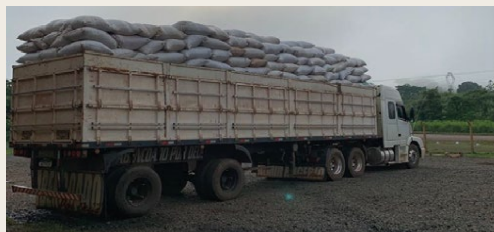
Recepção de amendoas de cacau na Gencau-PA.